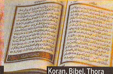
Koran, Bibel, Thora