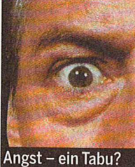
Angst – ein Tabu?