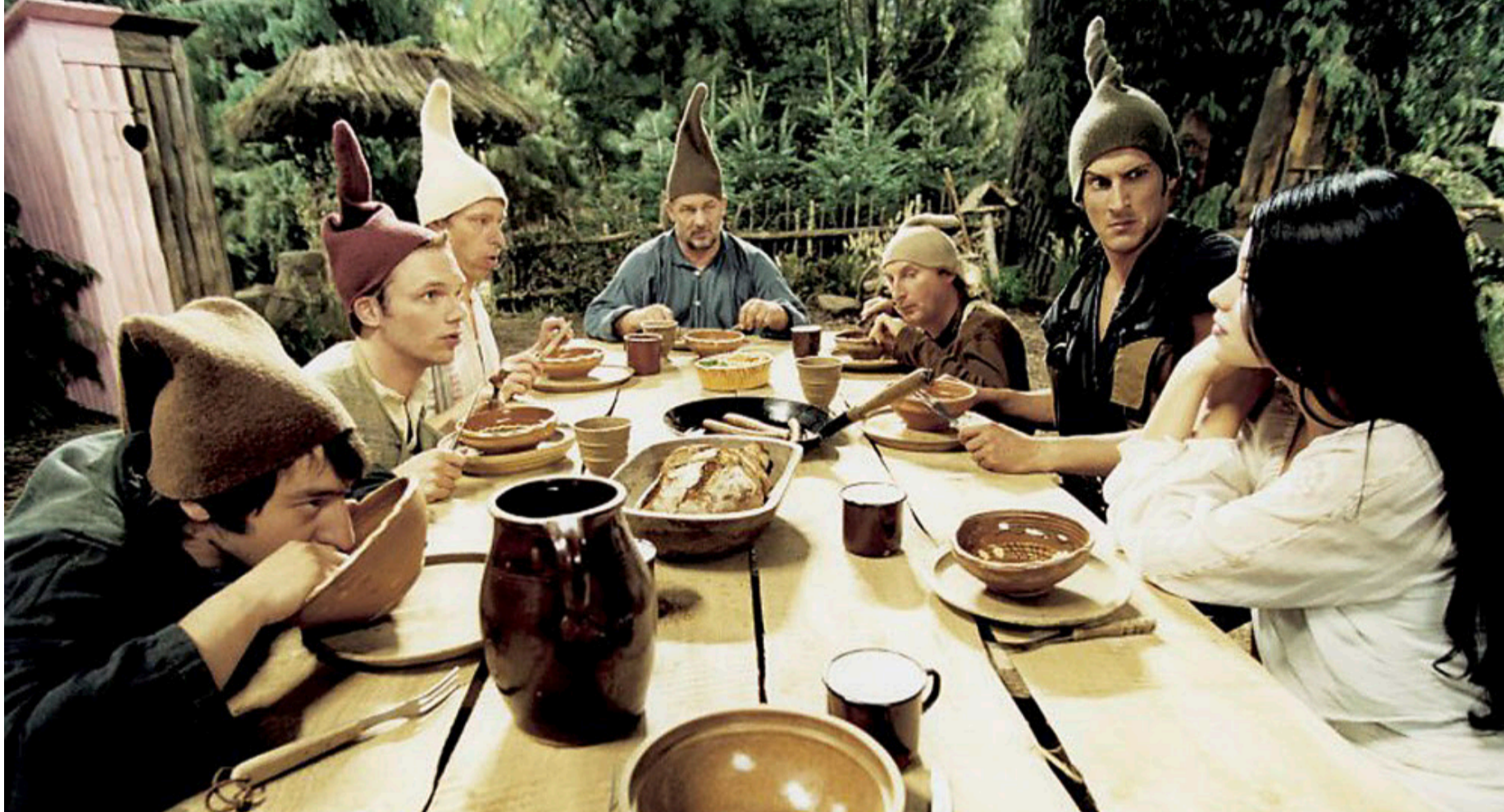
Die sieben Zwerge heute: verwirrte, ungehobelte Hampelmänner mit Hang zu unfreiwilliger Komik (Szene aus der deutschen Filmkomödie «7 Zwerge – Männer allein im Wald»).